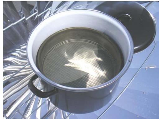
Springform auf Backstein