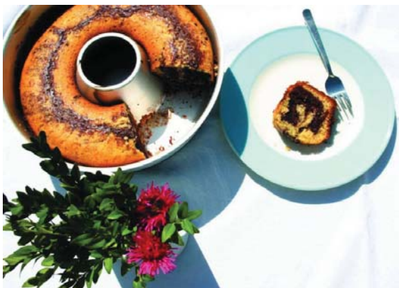
After approximately 40 minutes baking time the bread (300 g) is ready.