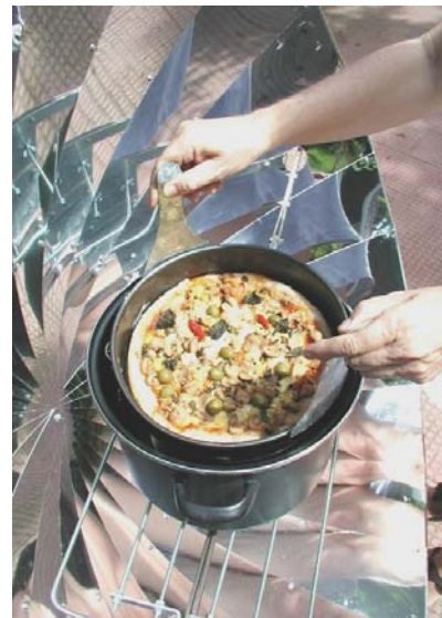
Alles ist möglich!