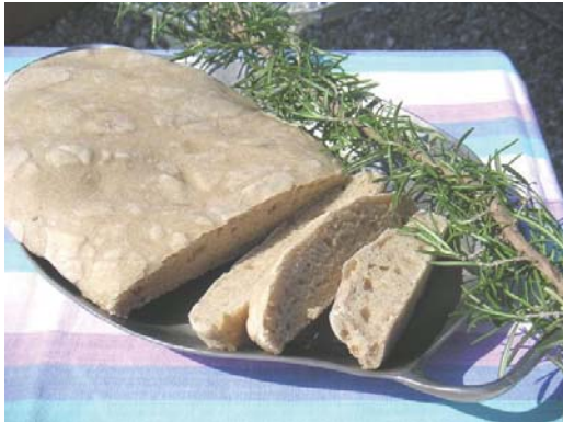
Nach ca. 40 Minuten Backzeit ist das Brot (300 g) fertig!

Tip: You can bake 2 to 3 flat breads in one go if you place them in layers with a small separation in between.