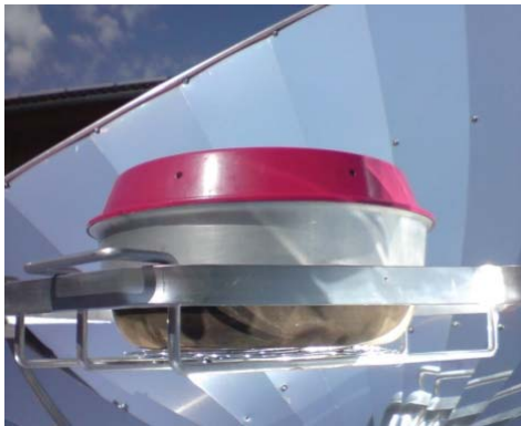
Backofen von Omnia