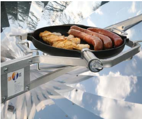
Wurst, Fleisch und Gemüse grillen

Zum Grillen eine Pfanne mit geriffeltem Boden oder eine geriffelte Grillplatte verwenden. Die Pfanne auf den Rost stellen, die Grillplatte direkt auf die Topfhalterung setzen (siehe Bild unten).